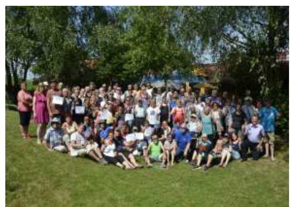
Srečanje gluhih iz Savinsko-Štajerske regije v juniju

"Največja nagrada za človekov trud ni tisto, kar bo zanj dobil, temveč tisto, kar bo postal. (John Ruskin )"