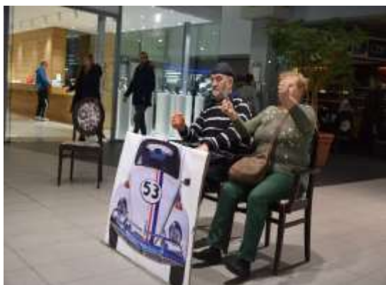
Vaje iz dramskega igranja