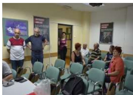
Predavanje pod strokovnim vodstvom o zdravem gibanju in zdravem telesu

Tudi najmodrejši um se mora še česa naučiti. (George Santayana)