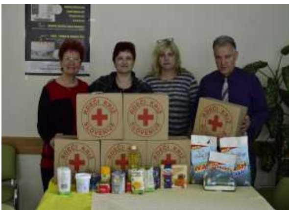
Donacija Rdečega križa v maju