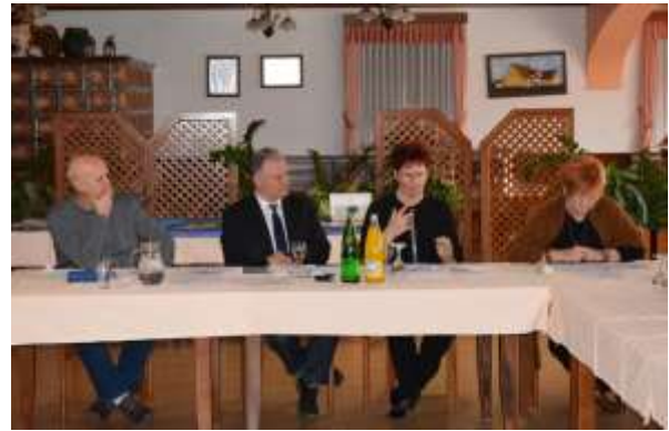
Zasedanje skupščine DGNP v februarju