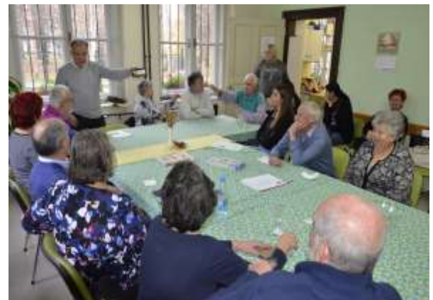
Druženje med kuharsko delavnico v decembru

"Dolgčas je bolezen srečnih ljudi; nesrečnim ni nikdar dolgčas, ker so preveč zaposleni. (Abel Dufresnes)"