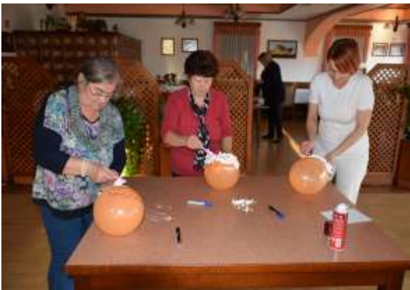
Praznovanje dneva žena v marcu