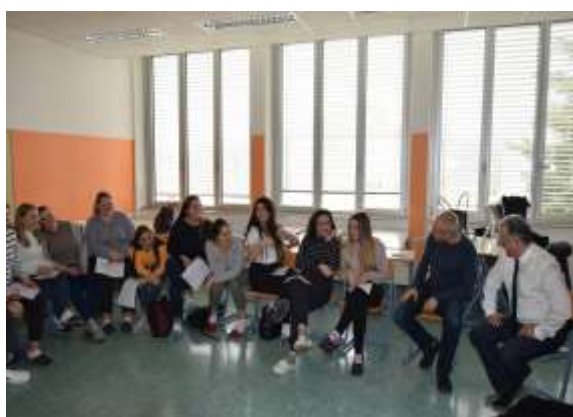
Predstavitve SZJ na srednjih šolah v Mariboru in okolici

V ta namen so bila organizirana predavanja o, skrbi za zdravje, boleznih, pravilni prehrani, športu, kulturi, skrbi za varnost v prometu, poznavanje naše države in poznavanje kultur drugih dežel, poznavanje se spopadati se dostojnim preživetjem in še bi lahko naštevali.