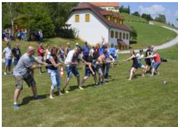
Med tekmovanjem v vlečenju vrvi na srečanju gluhih Štajersko Savinske regije