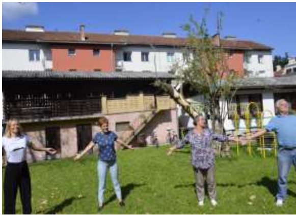
Pozdrav soncu v septembru