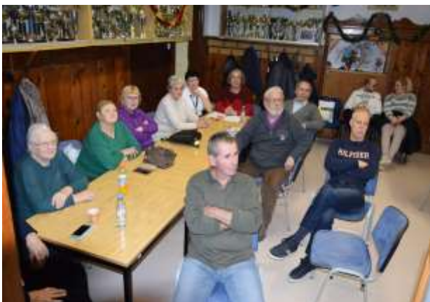
Pozorno spremljanje dogajanja in informiranja