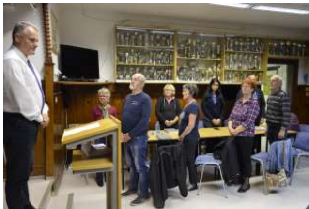
V spomin našemu članu