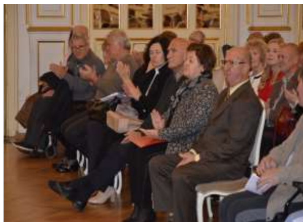
Predstavniki MOM in Sveta invalidov

S kulturnimi točkami so se predstavili člani devetih invalidskih društev: Medobčinsko društvo Sožitje Maribor, Sonček — Mariborsko društvo za cerebralno paralizo, Društvo gluhih in naglušnih Podravja Maribor, Medobčinsko društvo slepih in slabovidnih Maribor, Invalidsko društvo ILCO Maribor, Medobčinsko društvo civilnih invalidov vojn Maribor, Varstveno delovni center Polž Maribor, Društvo vojnih invalidov Maribor, Medobčinsko društvo delovnih invalidov Maribor in Društvo paraplegikov Podravja.