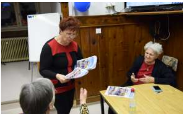
Gluhim je branje v veliko korist pri sporazumevanjem z ostalim okoljem

V časopisu iz sveta tišine lahko tudi naše društvo objavlja svoje prispevke. Zelo smo ponosni na naš časopis in želimo še veliko let dobrega dela.