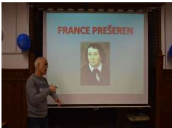
Predavanje o našem največjem Slovenskem pesniku in kviz na to temo

Društvo že vse od začetka svojega delovanja daje velik poudarek na izobraževanju svojih članov. Izobraževanje pomeni velik potencial za enakopravno vključevanje gluhih v socialno in družbeno življenje.