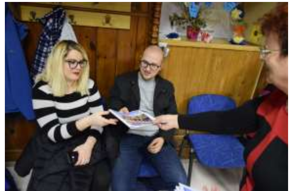
Naše članke objavljamo tudi v časopisu »Iz sveta tišine«

Gluhim osebam zelo koristi branje. V časopisu Svet tišine imajo gluhi veliko lahkega branja iz socialnega življenja in družbe nasploh. Z branjem lahko gluhe osebe slišijo. Pogovarjajo se z rokami in z rokami pokažejo besede. Za vsako besedo naredijo drugačen gib. Takemu gibu rečemo kretnja.