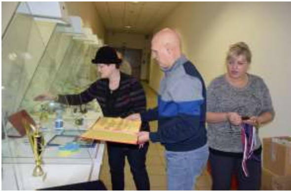
Razstava v TC QLANDIA v januarju