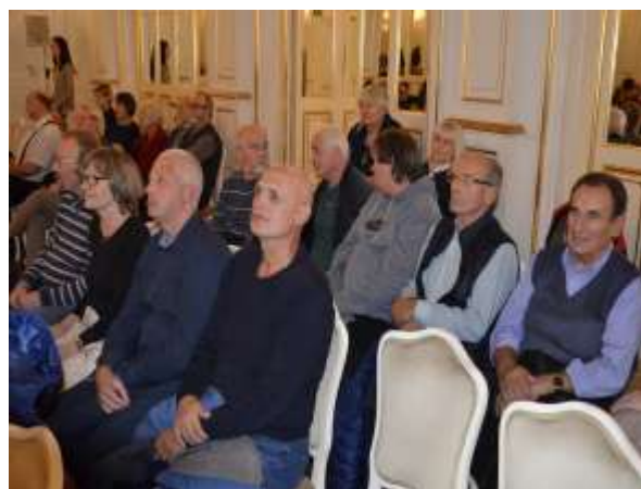
Gluhi navdušeni nad programom