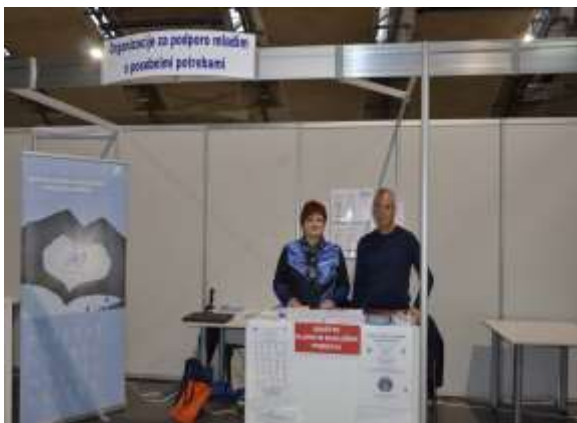
Sodelovanje na kariernem sejmu v novembru