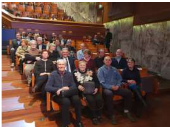
Obisk kulturnih prireditev

Opravljamo prevoze in spremstva članom, ki so potrebni pomoči druge osebe, da se lahko vključijo naše programe. Sodelujem na raznih pomembnih obletnicah in kulturnih dogodkih, ki so pomembna za naše delovanje. Društvo za svoje člane redno, vsako leto organizira tudi strokovne ekskurzije.