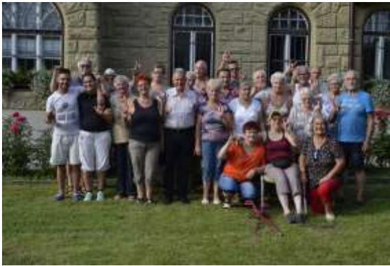
Gasilska slika po družabnem srečanju, pikniku v juliju