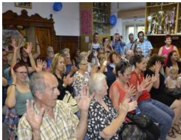
Na prireditvi - donacija baterij za slušne aparate