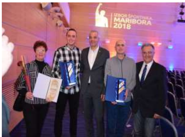
Na podelitvi priznanj za športnika leta 2018