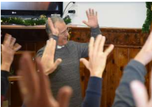
Strinjanje in potrjevanje predlaganih aktivnosti