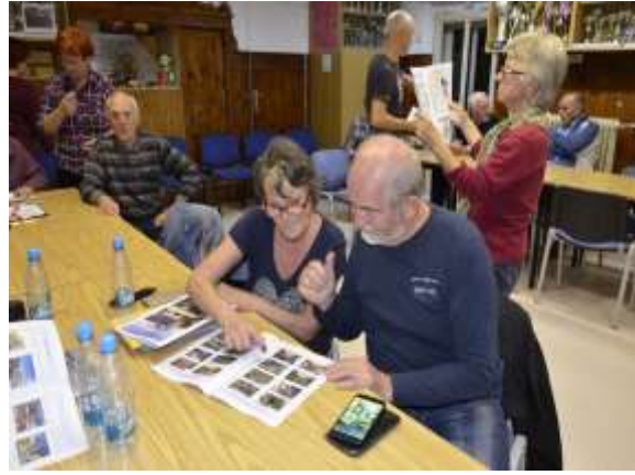
Pri prebiranju našega časopisa