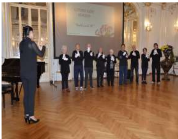
Nastop kulturne skupine Tihi svet

To je bil čudovit dogodek, in zelo pozitiven, da se lahko tudi invalidne osebe pridružijo kulturnim dogodkom slovenske družbe.