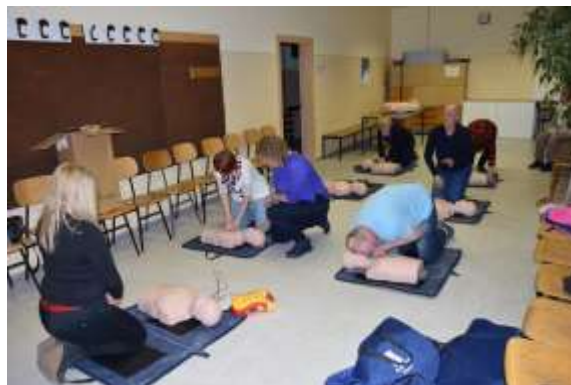
Usposabljanje na tečajih