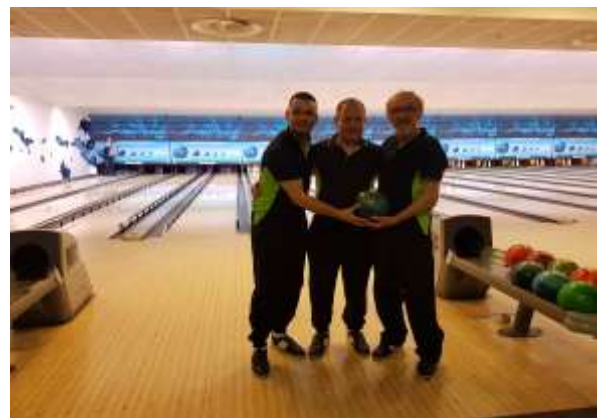
Športni trenutki na bowlingu v aprilu