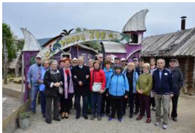
Na izletu ZOO Slovenske Konjice