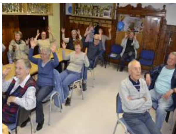
Na informativnem druženju