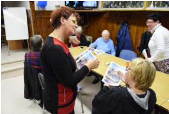
Radi prebiramo časopis našega društva »Naš glas«

Branje je pravica vsakega človeka. Gluhe osebe težje berejo, zato potrebujejo lahko branje. Zelo pomembno je, da uredniki časopisov prilagajajo svoje pisanje čim bolj razumljeno gluhim. Časopis Iz sveta tišine, ponuja veliko dobrega in poučnega branja.