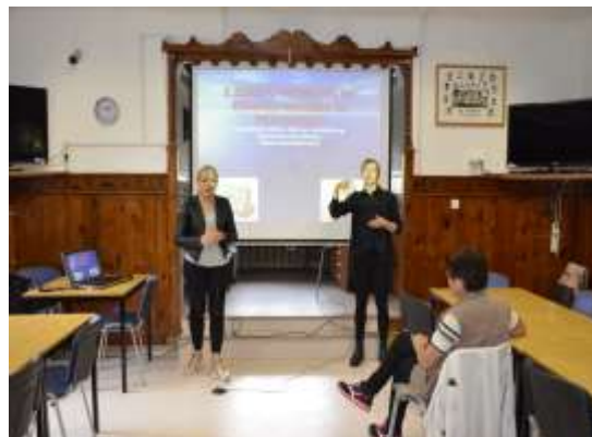
Strokovno predavanje o zdravi prehrani

Velik poudarek našega delovanja pa temelji tudi na sodelovanju s sorodnimi društvi. Ob začetku vsakega leta si zastavljamo jasne cilje, ter načrtujemo aktivnosti za njihovo uresničitev.