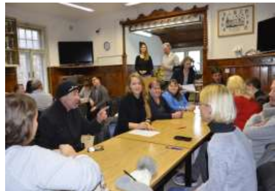
SNG s svojim projektom in s člani DGNP Maribor

Dvanajst slovenskih gledališč je podpisalo zavezo o sodelovanju, da si bodo gluhi in naglušni lahko tudi v novi gledališki sezoni ogledali izbrane stalne predstave.