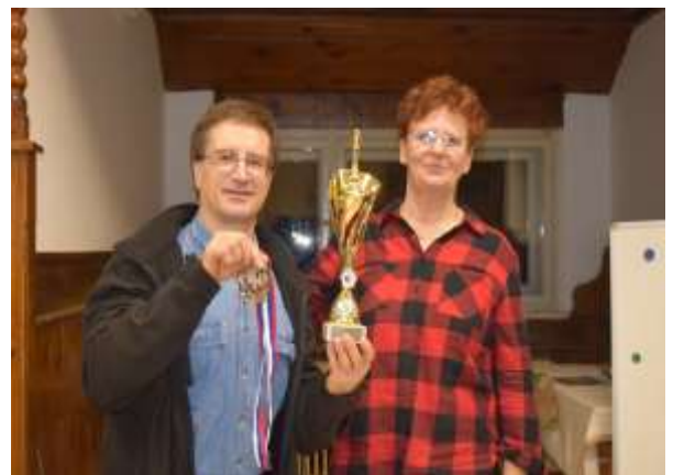
Obveščanje o veselih dogodkih in priznanjih