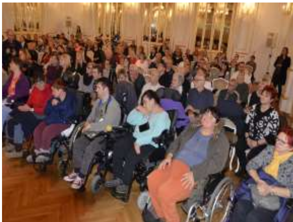
Zbrani invalidi na prireditvi