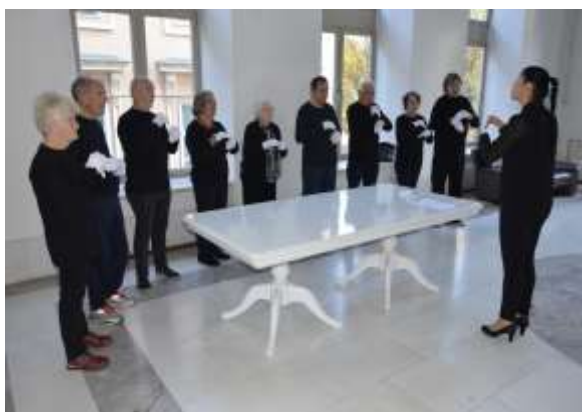
Generalka pred nastopom

Med mnogimi nastopajočimi so nastopali tudi gluhi invalidi s kulturno skupino Tihi svet. Posebej počaščeni in hvaležni so bili, da so lahko tudi to leto sodelovali v kulturnem programu, še posebej pa za prejeto "Zahvalo župana mestne občine Maribor za neprecenljiv prispevek k bogatenju kulture invalidov".