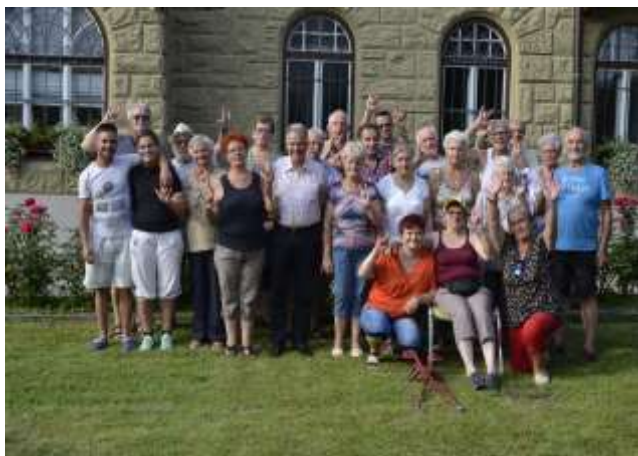
Po poletnem pikniku