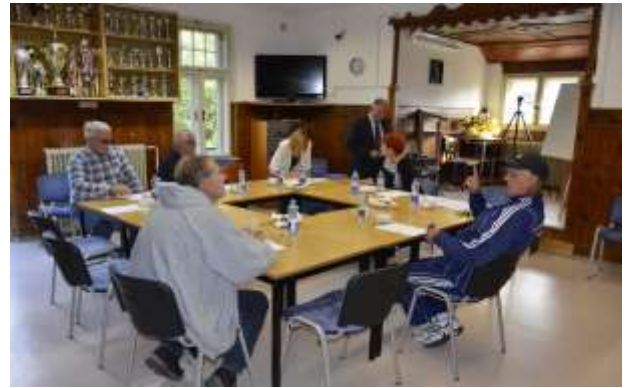
Sestanek upravnega odbora v avgustu