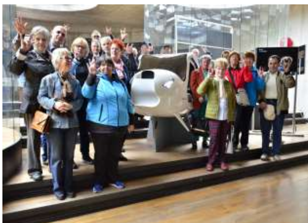
Pri ogledu vesoljskega centra Vitanje