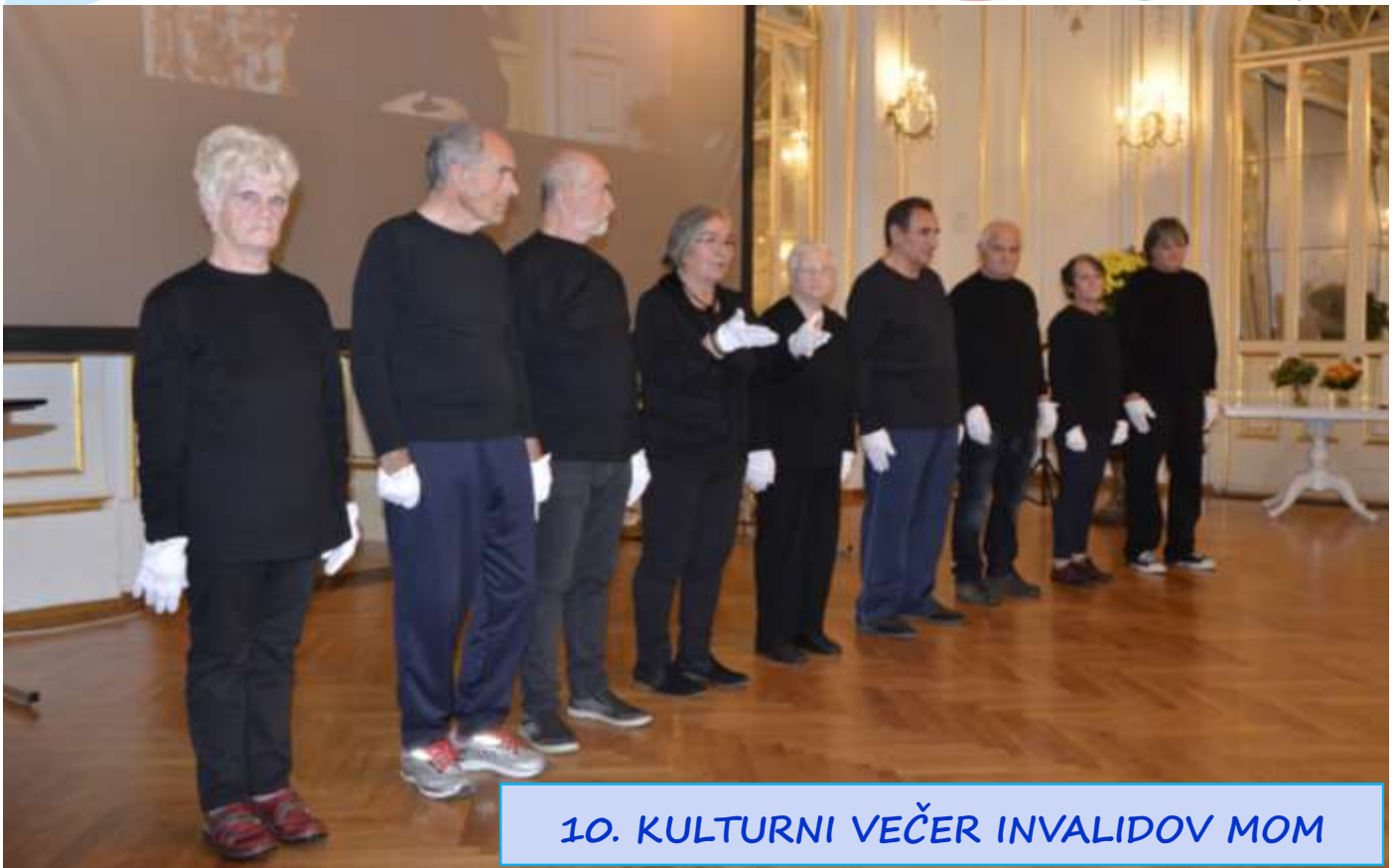
10. KULTURNI VEČER INVALIDOV MOM