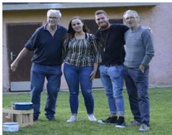
Med kostanjevim piknikom