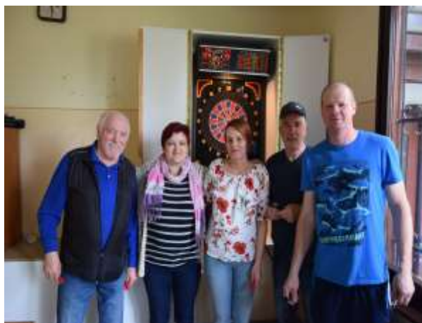
Po igranju pikada