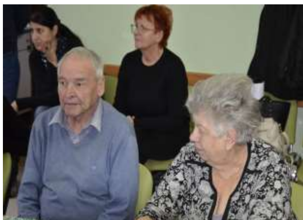
Med kulinarično razglednico