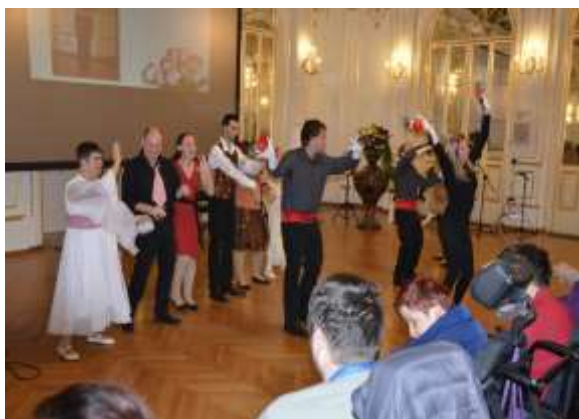
Nastopajoči VDC Sonček