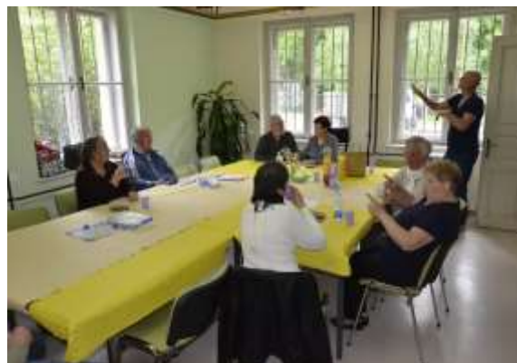
Kuharska delavnica: teoretično poznavanje kulture in značilnosti kulinarike po svetu, ter praktično izvajanje pri pripravi jedi

Dodatno izobraževanje ali usposabljanje je kot način motiviranja članov za pridobivanje novih znanj, ter strokovni in osebnosti rasti posameznika in našega društva.