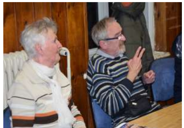
Diskusija in vprašanja