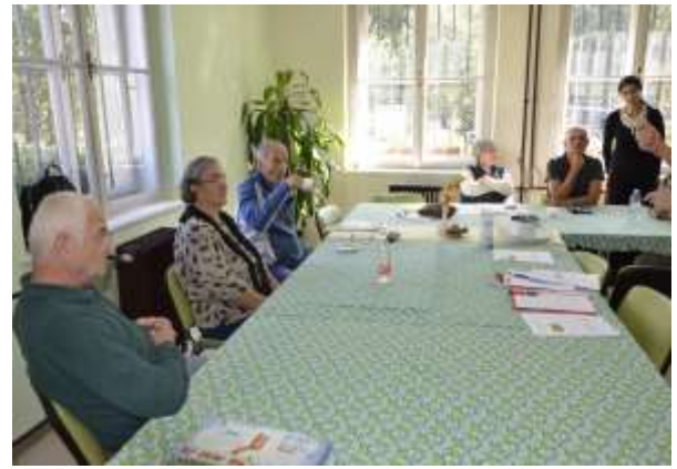
Učenje novih besed SZJ v oktobru