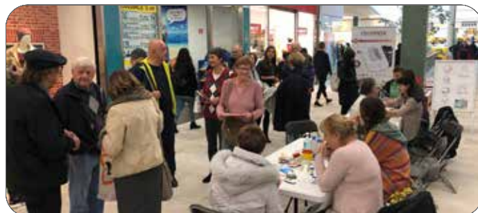
Veliko zanimanje za brezplačne meritve

Uspešna akcija je bila dodaten kamenček v mozaiku prizadevanj, da bi ljudje spoznali in ozavestili dejavnike tveganja, ki so lahko vzrok za možgansko kap, s tem pa tudi prevzeli odgovornost za zdrav način življenja.