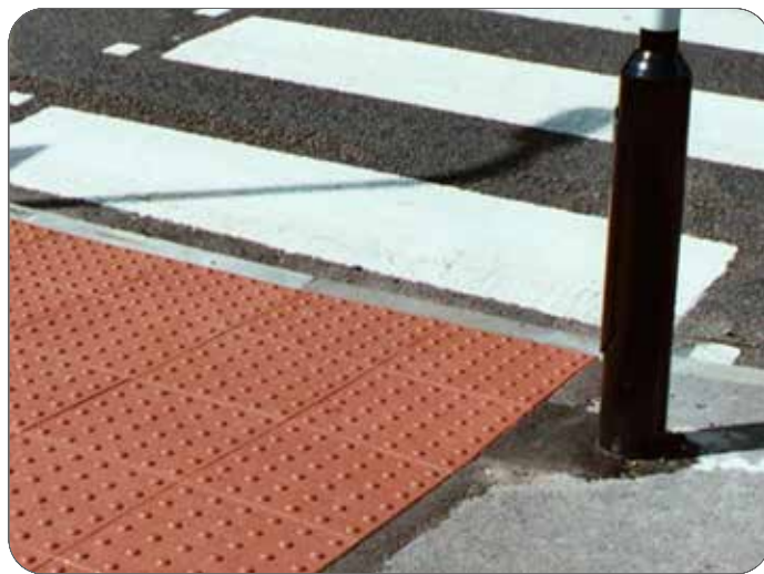
Taktilne oznake, vir: shorturl.at/sRSU6

Tudi na križišču Ptujška-Ruska bi želeli zvočni semafor. Kritične točke so tudi Meljska pri AP in vzdolž cele Ceste proletarskih brigad, kjer živi kar nekaj slepih in slabovidnih. Morda bi se namestilo nekaj na semafor, kar bi slabovidni pritisnili za vklop zvoka, ne pa da piska ob vsakem prehodu, kar lahko tudi moti stanujoče v bližini.