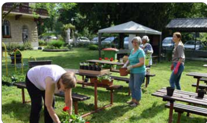
Akcija sajenja rož