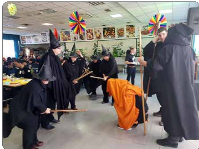
Pustovanje na Ptuj – Stanovanjska skupina Sožitje Maribor – čaravnice

ozdravili in prenašajo atome dobre volje naprej na čim več ljudi. Čas smo ob vsem dogajanju izkoristili še za ples in klepet s prijateljskimi maskami, in prijetno popoldne se je hitro prevesilo v večer, ko smo polni lepih vtisov odšli domov.