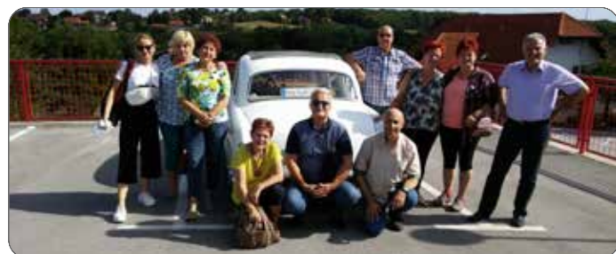
Udeleženci izleta po Prekmurju

S kosilom smo zaokrožili naš enodnevni izlet. Proti domu smo se vračali zadovoljni, saj je bil dan lep in poln novih znanj in pogledov na lepo panonsko nižino.