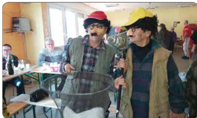
Nagajivo pustno rajanje

Hvala vsem, ki ste po svojih močeh pomagali pri pripravi in izvedbi tega veselega in norčavega pustovanja.