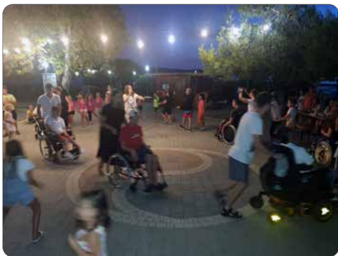
Zdravstveno-terapevtska kolonija na Debelem rtiču

Na začetku leta verjetno nihče izmed nas ni sumil, da se bo zgodila situacija, ki jo doživljamo od 13. marca 2020, ko je bila razglašena epidemija zaradi koronavirusa. Naenkrat se je ustavilo vse, zaprle so se šole in ostale institucije, začelo se je delo od doma. Društvo se je z izvajanjem osebne asistencije znašlo pred novim izzivom - organizirati delo v pisarni (vodje, strokovne vodje in usklajevalke) od doma, hkrati pa uporabnikom zagotoviti nemoteno izvajanje osebne asistencije na njihovem domu. Priznamo, da nas je predvsem v prvem obdobju epidemije obdajal strah pred neznanim, strah pred novim virusom, ki je zares posegel v življenje slehernega posameznika.