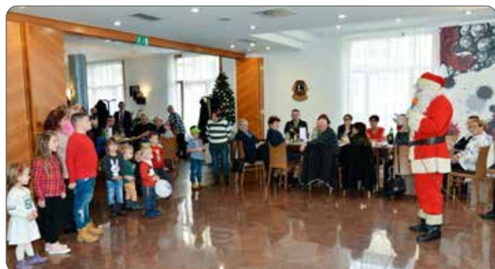
Najmlajše je obiskal Božiček

Razigranost in veselje sta se nadaljevala ob zvokih prijetne glasbe, ki je marsikoga zvalila na plesišče.