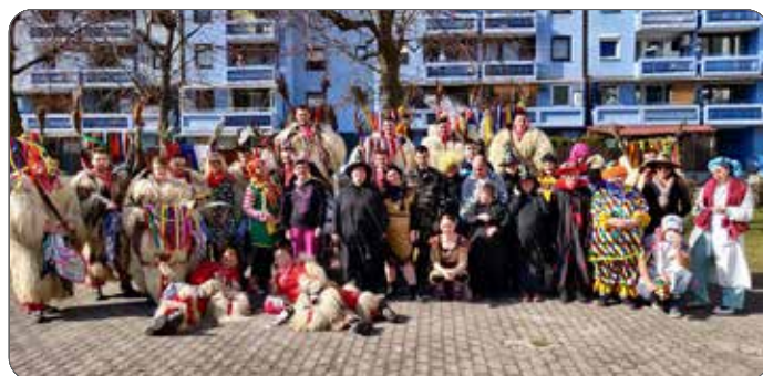
Pustovanje v VDC-ju Sožitja Maribor z obiskom Korant kluba Lasigovci

Po tako zabavnem pustnem dogajanju lahko le upamo, da bomo v prihodnjih letih enako lepo preživeli najbolj norčav čas v letu, ko so dovoljene vse traparije, ko lahko postanemo vse, kar si želimo, ko pustimo domišljiji prosto pot in ko lahko predstavimo tudi svojo bolj norčavo plat osebnosti.