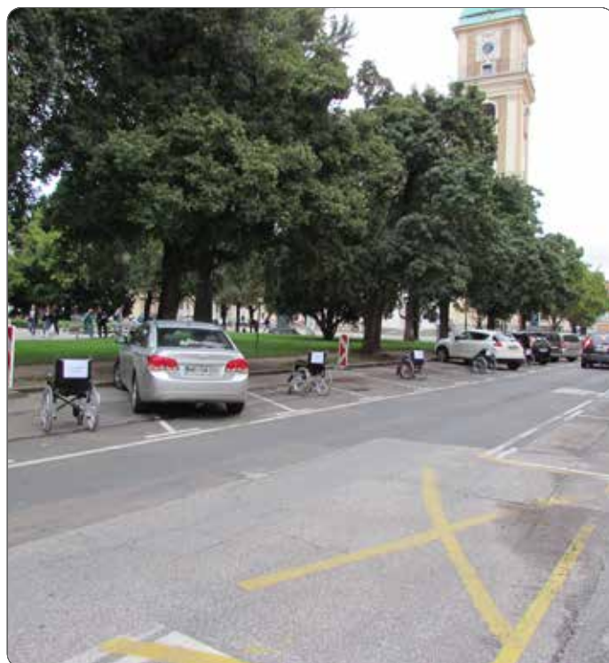
Opozarjanje na problematiko neupravičenega parkiranja na prostorih za invalide

Vsako društvo je predstavilo svoj način mobilnosti, težave, pripomočke in posebnosti pri premagovanju ovir v vsakdanjem življenju. Predstavili so se: Medobčinsko društvo delovnih invalidov Maribor; Društvo bolnikov po možganski kapi Podravja Maribor; SONČEK - Mariborsko društvo za cerebralno paralizo; društvi SLO - CANIS in REPS; Društvo gluhih in naglušnih Podravja Maribor; Društvo diabetikov Maribor in Humanitarna organizacija INKONT Maribor.