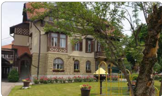
Lepo urejeno dvorišče društva Dom

Lepo urejena okolica potrebuje vzdrževanje skozi vse leto za kar lahko poskrbimo le skupnim prizadevanjem, da ohranjamo čisto in urejeno okolico.