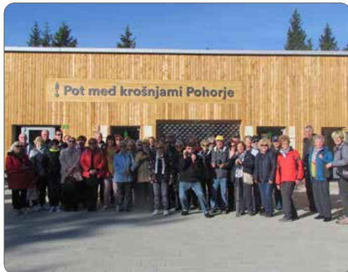
Izlet na Roglo

Pravo doživetje v osrčju pohorskih gozdov na vrhu Rogle je bilo v oktobru 2019, ko smo prehodili celotno Pot med krošnjami, vključno z razglednim stolpom. Imeli smo čudovit dan, s soncem obsijan. Posebno doživetje narave nam je ponujala 1000 metrov dolga pot, ki nas je popeljala skozi raznolik gozd. Po čudovitem pogledu na Kamniško-Savinjske Alpe smo se povzpeli še na 37 metrov visok razgledni stolp, od koder je pogled na pohorsko naravo edinstven.