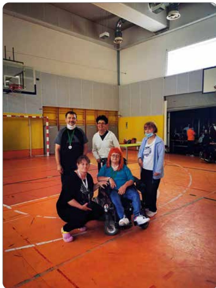
Tekmovanje v disciplini boccie

vstveno-terapevtskih kolonij (eno zimsko v februarju in tri poletne v avgustu). Program-zdravstveno terapevtskih kolonij je zelo pomemben, saj je namenjen otrokom in mladostnikom s cerebralno paralizo, ki so v enem tednu deležni nefizioterapij, delovnih terapij, izkušenj z novimi situacijami v drugem okolju ter učenja za življenje. Izvajamo dva termina družinskih kolonij s predšolskimi otroki, kjer so podpore in pomoči s strani strokovnjakov deležni tudi starši v obliki delavnic in šole za starše. Program zdravstveno-terapevtskih kolonij temelji na celostnem pristopu, ki vključuje različne aktivnosti v enotedenskem terminu. Namenjen je izboljšanju psihofizičnega stanja uporabnika, ob tem pa mu želi ponuditi izkušnjo novih in že obstoječih vsakdanjih socialnih veščin.