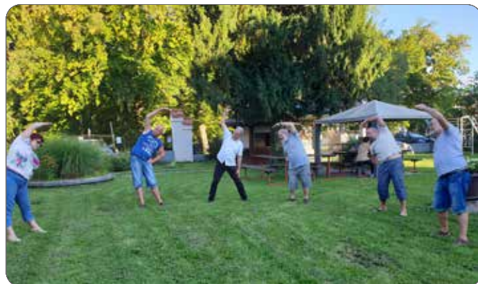
Glui telovadimo v naravi

Še posebej pa je vodstvo društva aktivno na področju spremljanja aktualne in nove zakonodaje, saj smo pripravili več pobud in dopisov za zagotavljanje informativne dostopnosti v slovenskem znakovnem jeziku, Zakon o osebni asistenci ter predlog zakona o dolgotrajni oskrbi.