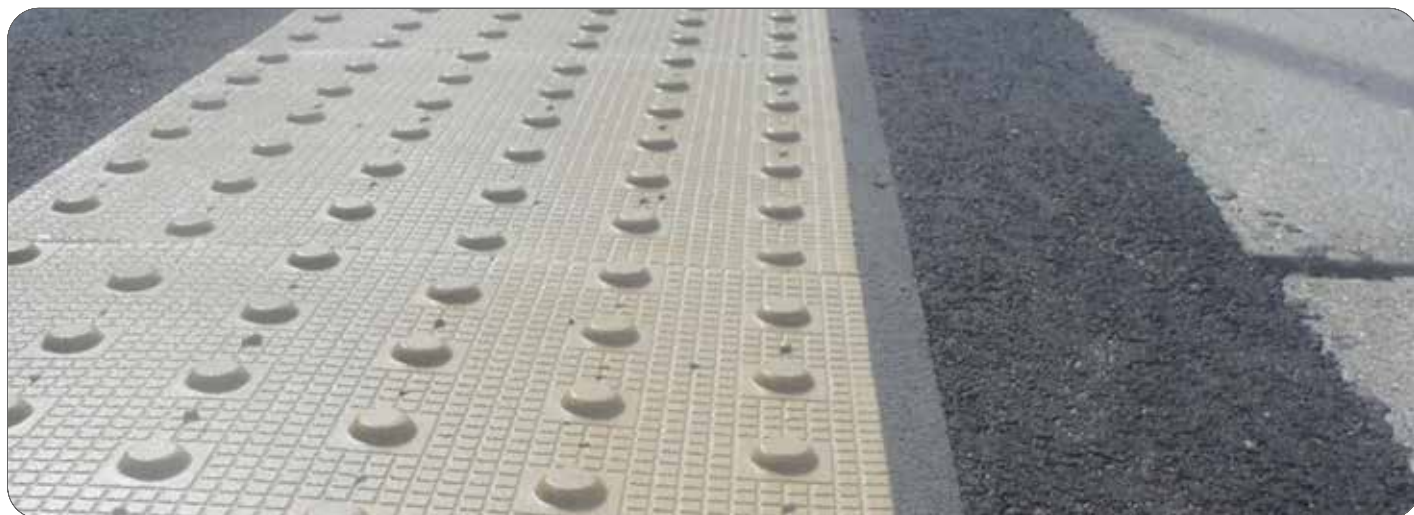
Taktilne oznake

O posvetu je poročala tudi RTV Slovenija, TV Maribor.