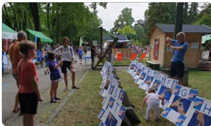
Predstavitve slovenskega znakovnega jezika

Društvo gluhih in naglušnih Podravja Maribor se je s kar šestimi prostovoljci tako kot vsako leto predstavilo na Art Kampu, kjer so ozaveščali obiskovalce o svojem delovanju, dejavnosti in skupnosti gluhih ter o slovenskem znakovnem jeziku. Mimoidoče so z govorico rok - slovenskim znakovnim jezikom - prijazno vabili k stojnici. Predstavili so enoročno znakovno abecedo, skupaj z najmlajšimi obiskovalci prebirali pravljice, opremljene z znakovnim jezikom, risali po pobarvanki s črkami v znakovnem jeziku in se skupaj učili o življenju v svetu tišine.