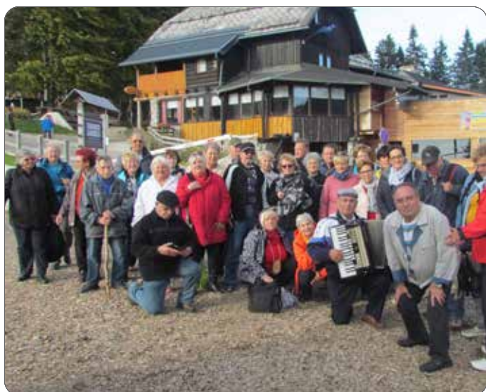
Izlet na Kope

Konec septembra 2019 smo se odpravili na Grmovškov dom na Kope. Na njihovi sončni terasi so nam na šaljiv način predstavili bogato zgodovino holcerije. Sledil je prikaz starih holcerskih opravil, ki smo jih lahko tudi sami preizkusili. Po koncu opravil so nam pripravili topel obrok. Ostali prosti čas smo izkoristili za krajši pohod in druženje.