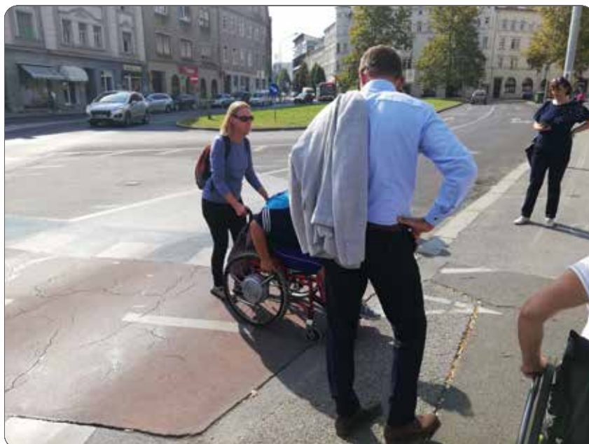
Sprehod z evidentiranjem arhitekturnih ovir – Dan mobilnosti invalidov 2020

Hkrati je na Slomškovem trgu potekala akcija osveščanja o težavah parkiranja na invalidskih parkirnih mestih »Pridem takoj«. Z invalidskimi vozički so že zjutraj zasedli 5 parkirišč na Slomškovem trgu, na vozičke pa obesili napise: »Pridem takoj, samo na pošto sem skočil.« in druge najpogostejše izgovore kršiteljev, ki parkirajo na invalidskih parkirnih mestih.