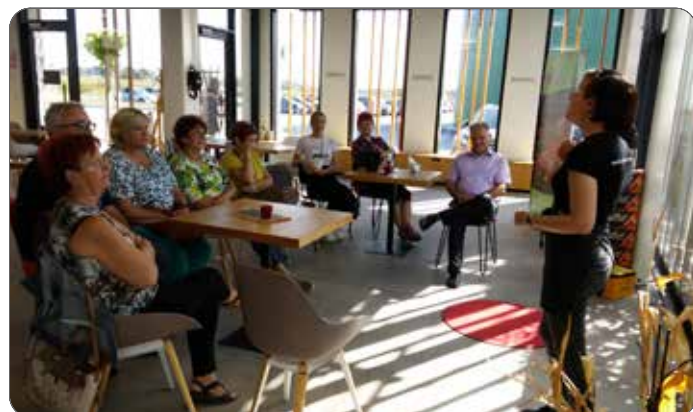
Predavanje v Luštu