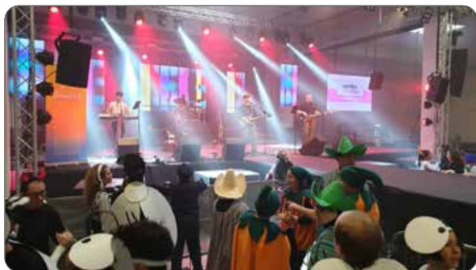
Pustovanje VDC-ja v Karnevalski dvorani