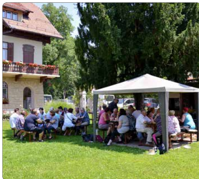
Prijetno druženje pred Domom

V jeseni računamo še na kostonjev piknik pa izlet ... Načrtov nam ne manjka, volje tudi ne. Upamo, da se bo izšlo.