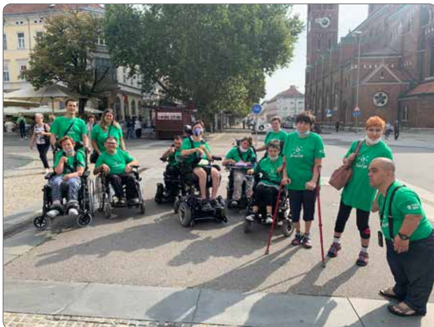
Ob Dnevu mobilnosti 2020

V načrtu imamo tudi vsakoletne, že tradicionalne dogodke,