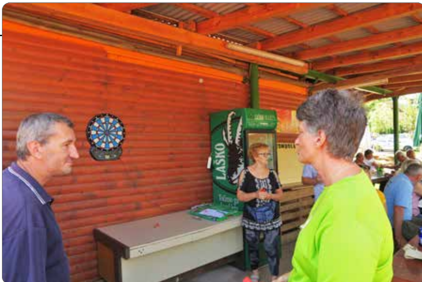
Pikado na športno-rekreativnem srečanju invalidov

Člani invalidskih društev iz Maribora so se pomerili v pikado, taroku in balinanju. Na voljo je bilo tudi igrišče za tenis, odbojko na mivki in badminton. Najuspešnejši so prejeli praktične nagrade, ki so jih prispevali naši donatorji. Priredili smo tudi tombolo in srečelov z bogatimi dobitki. Iskrena hvala vsem donatorjem, ki ste se odzvali na našo prošnjo.